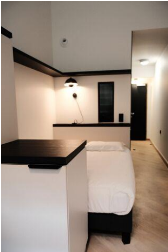
Studio sans mezzanine