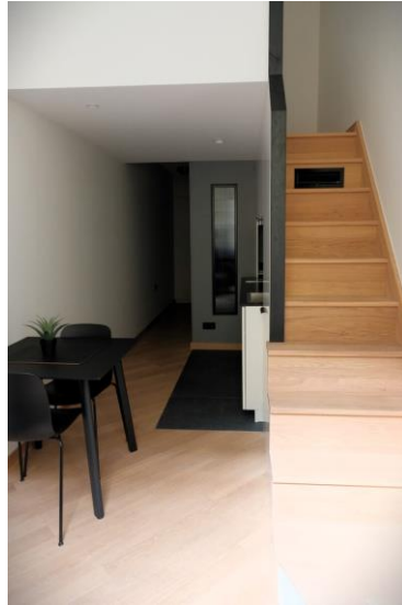
Studio avec mezzanine